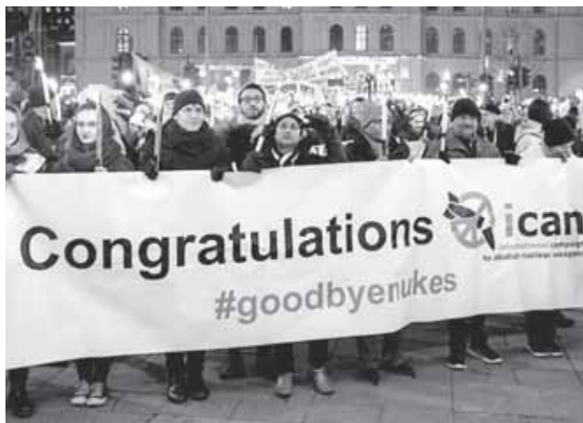
Die Entscheidung des Nobelpreiskomitees wurde auch draußen auf der Straße gefeiert.

US-Präsident Donald Trump kündigte im Februar 2018 an, die USA würden kleinere Atombomben entwickeln, die auch zu atomaren Erstschlägen eingesetzt werden sollen. Kurz darauf kündigte der russische Präsident Putin an, Russland habe bereits neuartige Atomraketen entwickelt, die von keinem Abwehrsystem abgefangen werden könnten