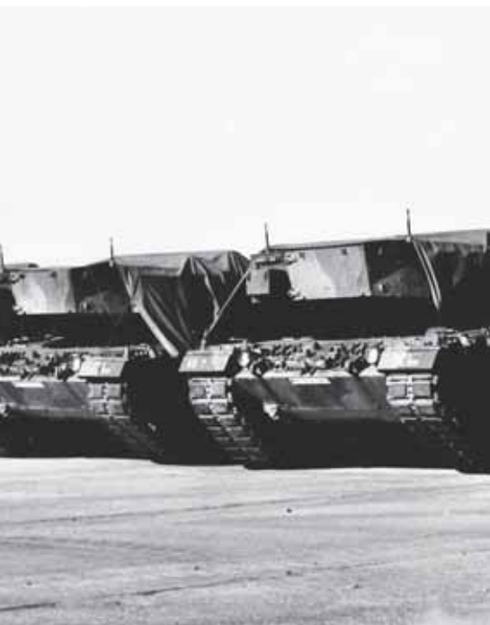
nach dem Abzug der Bundeswehr im Ausland im Kriegseinsatz oder sollen reaktiviert werden.

Sigmar Gabriel hat es 2013, als die SPD noch in der Opposition war, als Schande bezeichnet, dass Deutschland zu einem bedeutenden Rüstungsexporteur geworden war. Als Vizekanzler und Wirtschaftsminister der schwarz-roten Koalition genehmigte er dann 21 Prozent mehr deutsche Rüstungsexporte als die schwarz-gelbe Vorgängerregierung. Die deutsche Rüstungsindustrie empfand diese Genehmigungspraxis noch als nicht weitgehend genug und sie umgeht zunehmend die Exportrichtlinien.