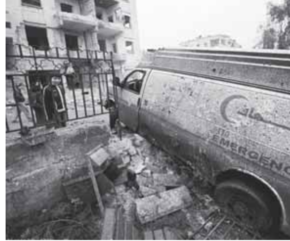
Zerstörter Krankenwagen in Aleppo 2012.

In der Region Ost-Ghuta gab es Anfang 2018 massive russische und syrische Luftangriffe. Dabei wurden auch die wenigen verbliebenen Krankenhäuser schwer getroffen. Die Ärzt*innen in der Region sind wegen der vielen Schwerverletzten völlig überlastet. Medizinisches Material ist Mangelware. Während eines von der UN ausgehandelten Waffenstillstandes sollte ein Konvoi des Roten Kreuzes Hilfsgüter in die Region liefern. Laut Angaben der Weltgesundheitsorganisation hat die syrische Regierung jedoch 70 % der Hilfsgüter beschlagnahmt, darunter auch Insulin, chirurgisches Material und Material für Traumaversorgung.