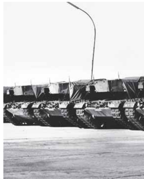
Viele der Leopardpanzer aus Hemer (Bild) landeten oder auf dem Schrott. Heute sind einige von ihnen

Besorgniserregender als Russland sind die massiven Erhöhungen der Rüstungsausgaben von China, Saudi-Arabien, Indien und Kuwait. Steigende Rüstungsausgaben unterminieren die Suche nach friedlichen Lösungen der Konflikte in der Welt.