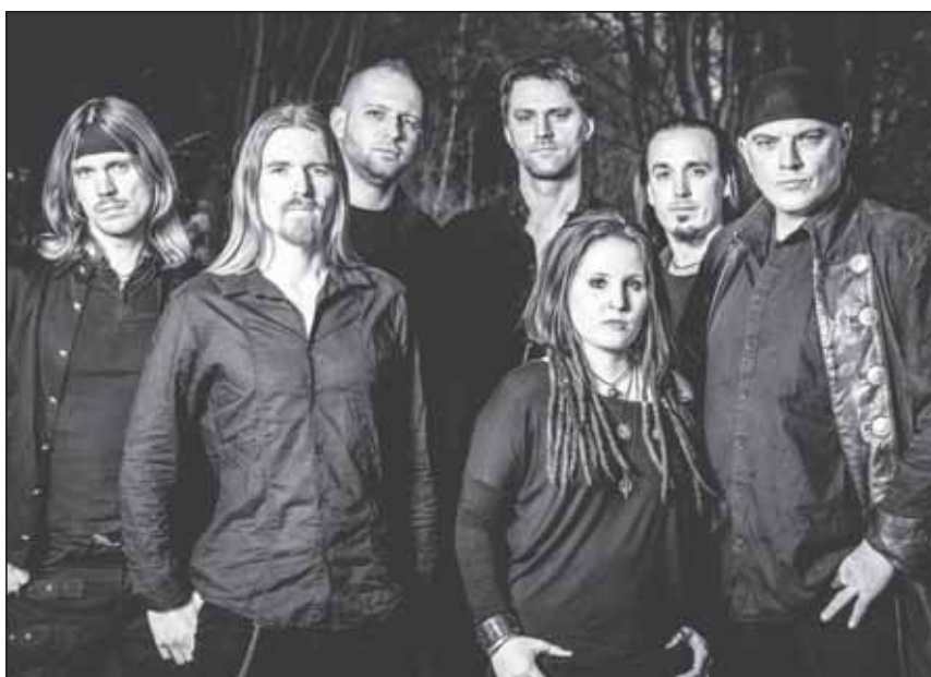
Nachtgeschrei auf dem Friedensfest 2017

of Gastarbeitsa (2003), Sorgente (2005), SPN-X (2003), Square the Circle (1995), Stoff (2012), Straight Ahead (1992), Strom & Wasser feat. The Refugees (2015), Subway to Sally (1997), Suit Yourself (2002), Sunburn in Cyprus (2007), Superfly 69 (2001), Superskank (2008), Survival Band (1992/93), Susunaga (2011), Swamphead (2001), Swim (2007), Tao Maurice (1995), Tarnfarbe (1997), T.A.S.S. (1995/2000), The Chairs (1995), The Bridge (2002), The Dead Flowers (2001), The Detectors (2009), The Generators (1999), The Heliolites (2006), The Hourglass (2015), The Idiots (2012), The Lane (1994), The March (1996), The Molly Bloom (1995), The Nerves (2014), The Razorblades (2004), The Shanes (2004), The Teenage Idols (1998), The Violet Tribe (2010), Torian (2013), Trace (2013), Trio Rousset (1992), TV Smith (1999), Tyrant Tea Club (1999), Überflüssig (2000), Uh Baby Uh (2004), U-Turn (2016), Vanishing Flower (1992), Velvet (2006/2009), Van Winkle (1998), Verenice (2004), Violet (2002), Vokale Küche (2007), Volxtanz (2009), Vor Ort Bluesband (1998), Walls have Ears (1994), Waste of Time (2005), Well packed meat (1993), Werkschor Auerweg (2011/2015/2016), Windrose (1994/95), Woeste (2016), Wonach wir suchen (2017), Wood's no metal (1998), Zaches (2001), Zaches und Zinnober (2013), Zeitloop (2005), Zirkus (2013), ZSK (2005).